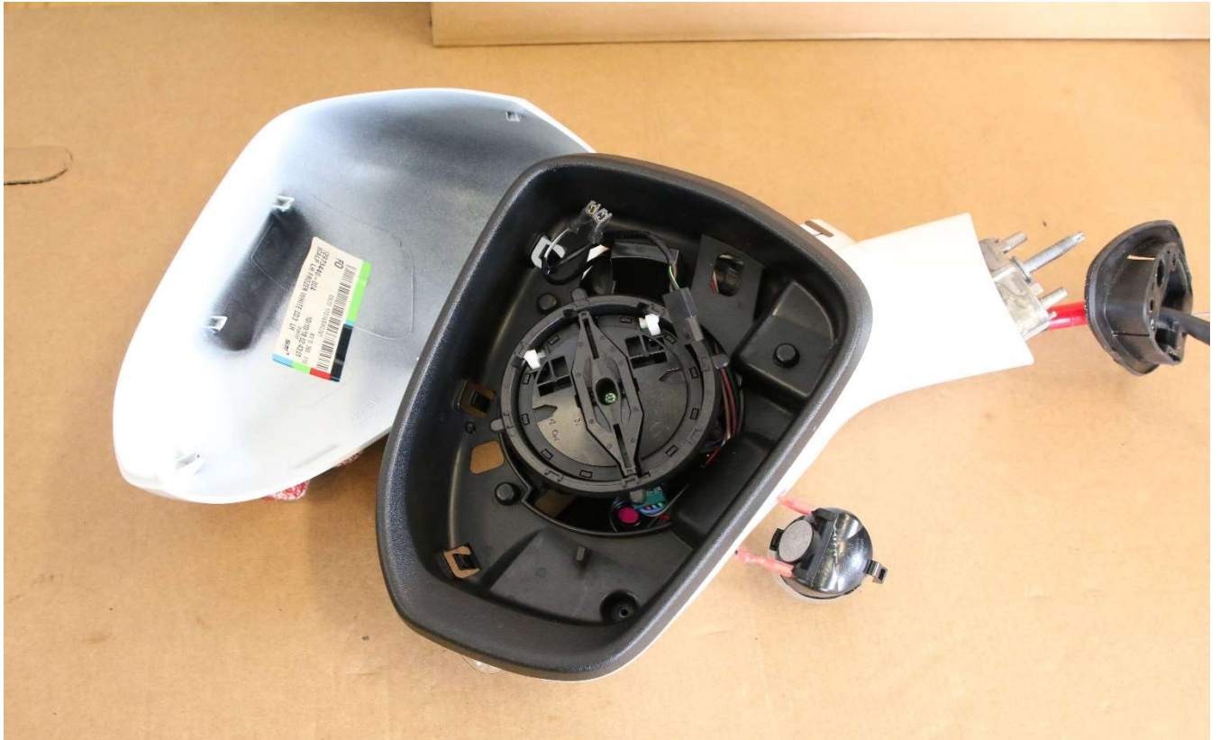
Bild 3: Außenspiegel Ford Mondeo, Bj. 2019 (alle Bauteile ohne Spiegelglas).