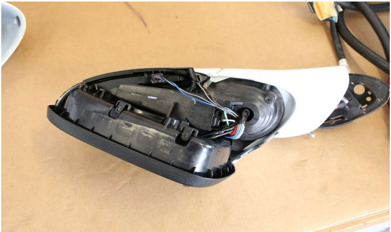
Bild 2: Außenspiegel Ford Mondeo Bj. 2019, teilerlegt (Blinker, Verkleidung und Motor nicht zerstörungsfrei demontierbar).

Die in der Ford-Arbeitsanweisung TSI NR.15-1073 vom 24.Juni 2015 beschriebene Vorgehensweise hinsichtlich der Demontage bzw. Zerlegearbeiten zum Außenspiegel konnte von den IFL-Mitarbeitern in einem Ford-Fachbetrieb und mit der Unterstützung der Spezialisten vor Ort nicht vollumfänglich nachvollzogen werden. Die Demontage der Spiegelverkleidung inkl. Blinker und des Motors konnte nicht abgeschlossen werden, da die Gefahr der Zerstörung der Teile bestand. Somit konnten diese Teile nicht zerstörungsfrei demontiert werden. Die Abdeckerarbeiten gestalten sich entsprechend schwieriger. Die Spiegelverstellung während der Lackierarbeiten lässt sich nur elektrisch angesteuert praktizieren, wobei darauf zu achten ist, dass Stromkabel von einer Fahrzeugbatterie oder eines geeigneten Ladegerätes nicht in eine Lackierbox reichen dürfen. Es besteht hier die Gefahr elektrischer Funken!