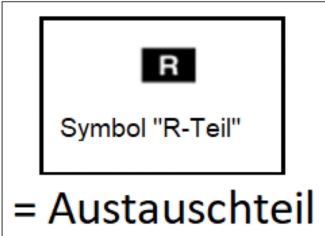
Bild 1: Auszug aus technischer Serviceinformation / Reparaturleitfaden Mazda - Kennung „R-Teil“